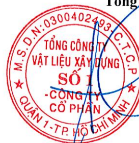
Cao Trường Thụ